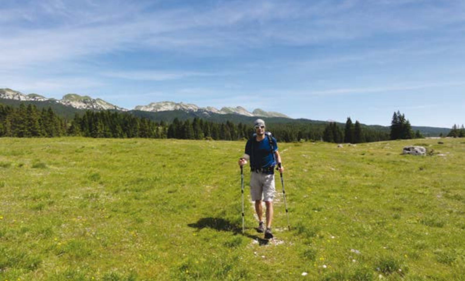
Sur les hauts plateaux du Vercors, loin de toute civilisation, les yeux s'écarquillent, l'esprit respire et se nourrit, le corps semble s'autoguérir...